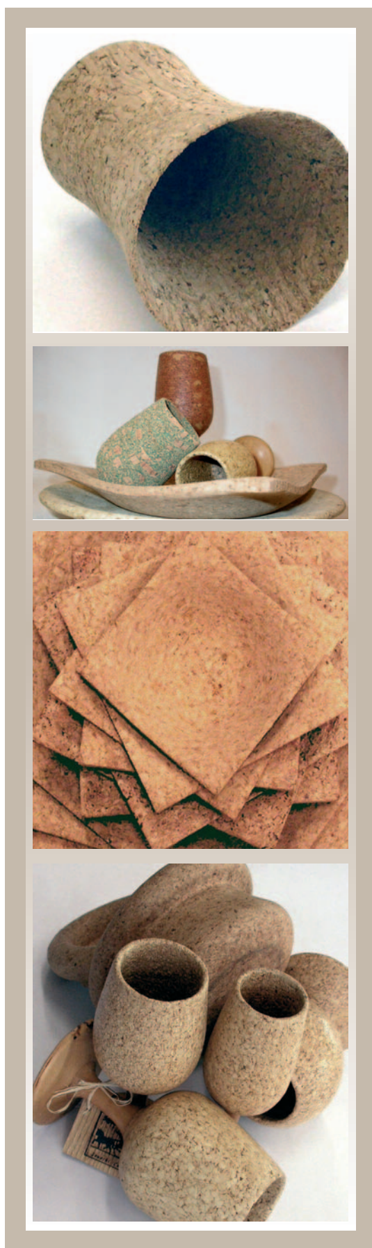
“ICHNOSUBER”: una linea di oggettistica ad uso alimentare, realizzata tramite una particolare tornitura di blocchi in sughero agglomerato... www.ansf.biz

la sicurezza negli ambienti di lavoro. Naturalmente nell'attività artigiana rimangono passaggi e fasi della lavorazione che non potranno mai essere meccanizzati. Ma la nostra esperienza ed abilità manuale è sempre abbinata all'utilizzo di prodotti innovativi: i processi produttivi vengono supportati dal ricorso alla progettazione assistita con strumenti CAD ed è stato raggiunto all'interno dell'azienda un buon livello di informatizzazione».